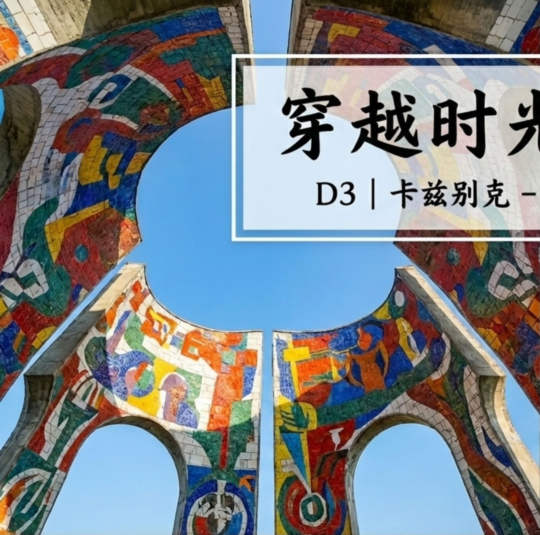
俄格友谊纪念碑 | 哥里斯大林博物馆