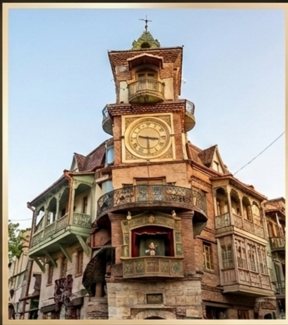
童话剧场·木偶钟楼