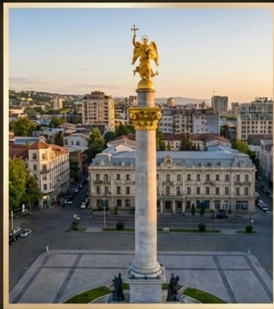
城市心脏·自由广场